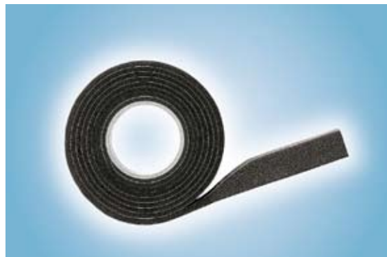
O.C.-Form BG1 Fogtätningsband