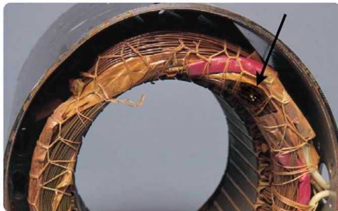
Detta lindningsfel orsakades av korttidsöverbelastning (spänning). En jordisolationstest (megger) upptäcker inte detta fel!

ALL-TEST PRO™ är ert bästa val för att upptäcka fel och för felsökning.